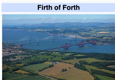
Firth of Forth

Continuing south, we enter Perthshire, Big Tree Country and a land of forests, rivers and mountains.