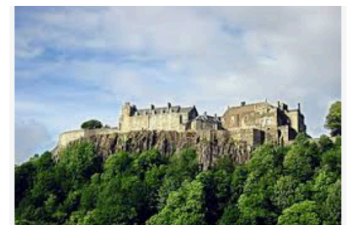
Stirling Castle – Wikipedia sv.wikipedia.org

Bussturen går enligt: "Heading north we pass the imposing ramparts of Stirling Castle and then skirt the Trossachs National Park (Rob Roy country).